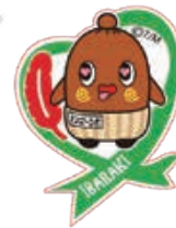
Illustration by 三月八日 ©Crypton Future Media, INC. www.paparo.net piapro