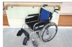
車いす等の貸出事業