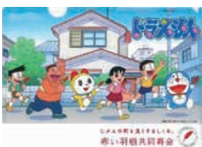
じまの町をよくするしくみ 赤い羽根共同募金