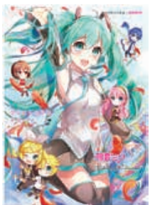
Illustration by 200 ©Crypton Future Media, INC. www.paparo.net piapro

稲敷市共同募金会では、上記イベントや江戸崎福祉センターにて募金に協力いただいた方へ、共同募金会オリジナルコラボグッズを差し上げています。