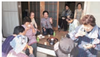
いきいきサロン活動