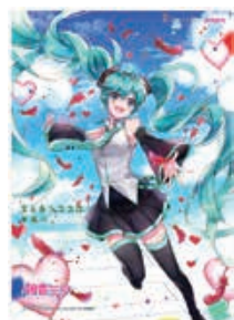
Illustration by 200 ©Crypton Future Media, INC. www.paparo.net piapro