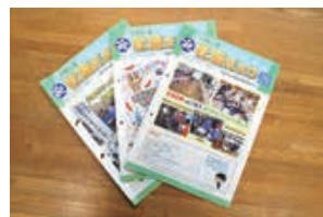
社協だよりの発行