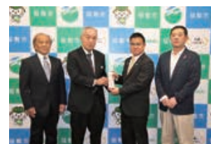
千葉県ヤクルト販売(株)様 協同組合聖苑香澄売店様