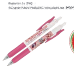
Illustration by EAG ©Crypton Future Media, INC. www.paparo.net piapro