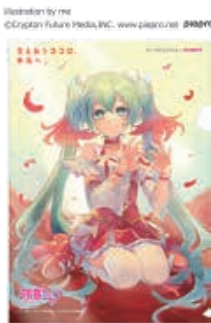
Illustration by mt ©Crypton Future Media, INC. www.paparo.net piapro