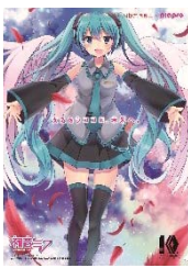
Illustration by みなみさき © Crypton Future Media, INC. www.piaspro.net

江戸崎福祉センター及びイベントにて募金に協力いただいた方には、共同募金オリジナルグッズを差し上げています。