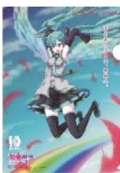
Illustration by RIG © Crypton Future Media, INC. www.piaspro.net