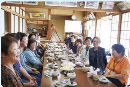
講義のあとは、食事を囲んでおしゃべりも楽しみの一つです