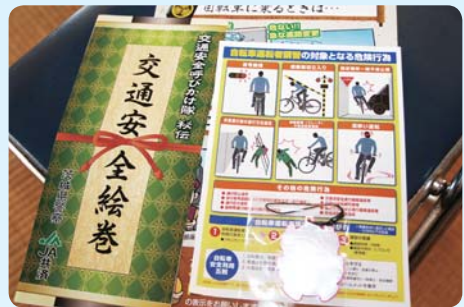
冊子や反射材などの交通安全グッズが配布されました