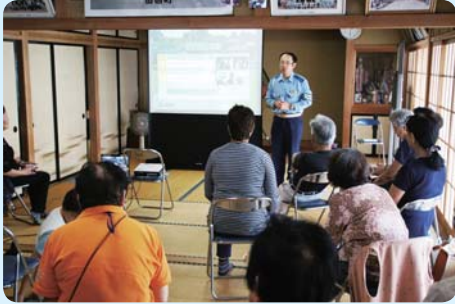
警察の方の講義を真剣に聞きます

参加した高齢者の方から笑顔で「おしゃべりが一番の楽しみ」という声もいただきました。このような取り組みが、地域の防犯力向上と「ふれ合い」から始まる助け合い向上に繋がる活動だと感じました。