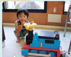
僕のぼっぼ(汽車)治ったよ