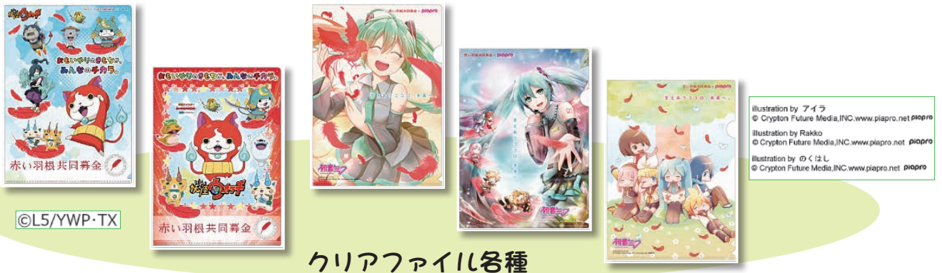
クリアファイル各種

江戸崎福祉センター及び11月1日開催の第8回ハートピアまつりで募金に協力していただいた方に、「妖怪ウォッチ」「初音ミク」共同募金コラボグッズを差し上げます。