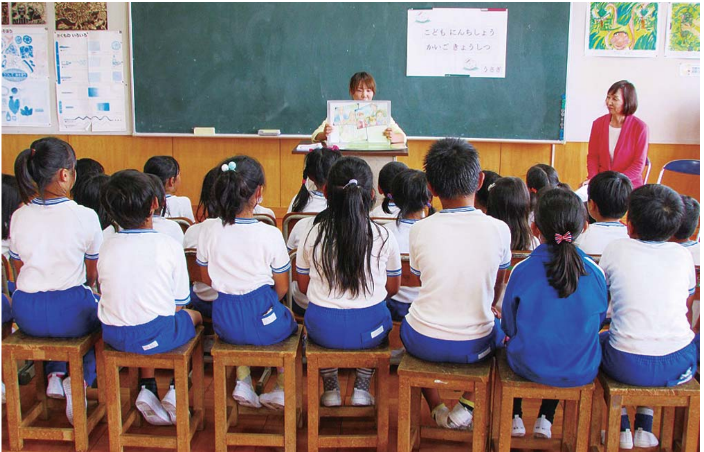
▲ あずま北小子ども認知症かいご教室