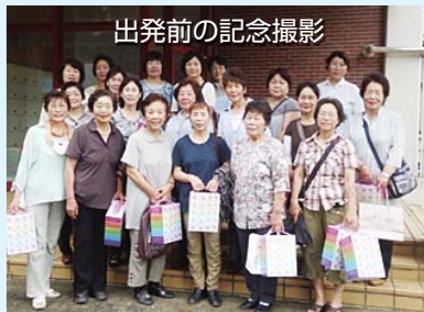
出発前の記念撮影