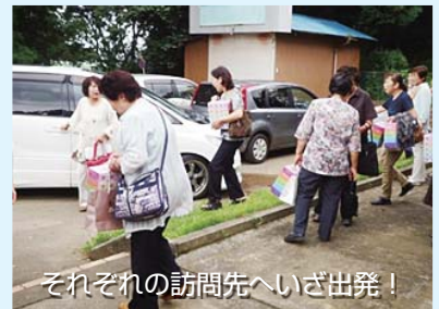
それぞれの訪問先へいざ出発!