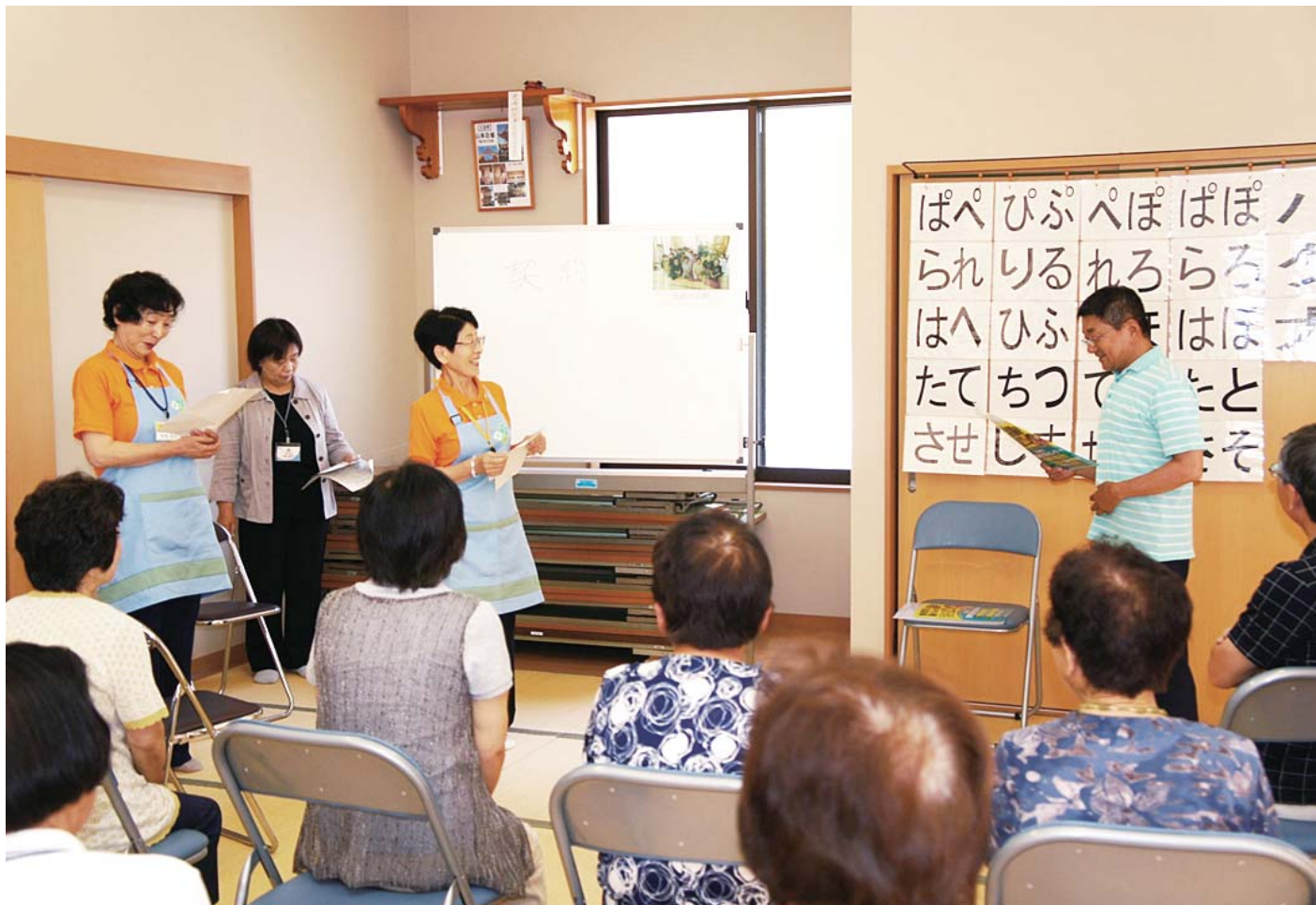
▲ 詐欺の犯人役と高齢者役に分かれて寸劇