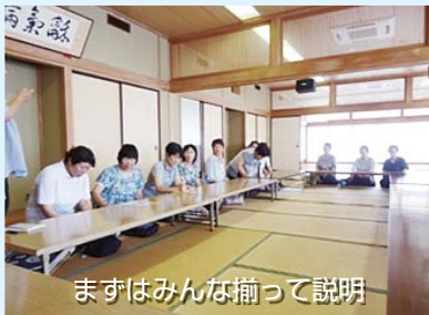
まずはみんな揃って説明

日赤奉仕団根本支部では、根本地区の高齢者を対象に年2回友愛訪問を実施しています。1回目の今回は、7月10日に実施され、ボランティア20名が2、3名に分かれ、根本地区の独居高齢者25件をティッシュボックスと熱中症予防ファイルを手に訪問しました。水分を十分取るよう注意喚起するほか、「変わったことはないかいっ!」と声かけを行いました。訪問先からも「お茶やってけよ」と一緒にお茶飲んだり談笑したりと楽しみのある活動となりました。根本地区は、近隣のボランティアに見守られ、安心安全な地域になっています。