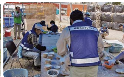
カキ養殖場のお手伝い