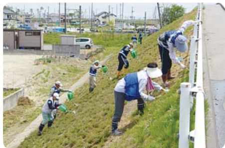
芝桜の草抜きと水かけ作業

先日6月8日(土)に一般参加者26名(うち女性10名)県社協職員3名稲敷社協2名の総勢31名により災害ボランティアバスを運行しました。早朝3時30分という出発時間にも関わらず、誰ひとり遅れることなく宮城県東松島市へ出発でき、芝桜の草抜き作業や、水かけのほか、地元のカキ養殖場のお手伝いボランティアで汗を流しました。