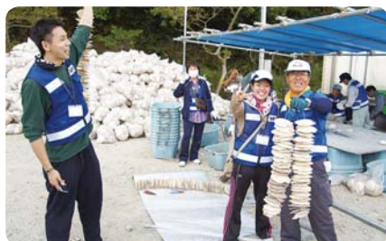
年齢は関係ない! 目的が同じだから……

参加者は、20代から70代までの初めて会った知らない人たち。すぐに打ち解け、和気あいあいと活動を行う、ボランティア活動の楽しさですね。また、現地の方々も「お疲れさま」「稲敷市知ってるよ! 遠くからありがとう」と、あたたかく接してくれました。