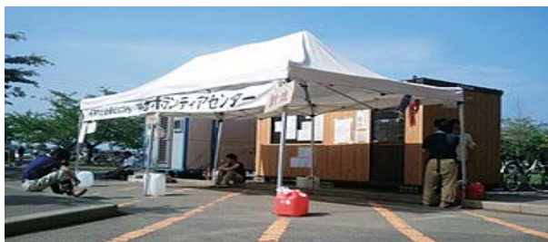
石巻市で復興支援活動を行う、チーム稲敷ボランティアみなさん。写真3 4 弾丸ツアー1泊2日有志9名で、石巻市で民家の泥だし出し活動。