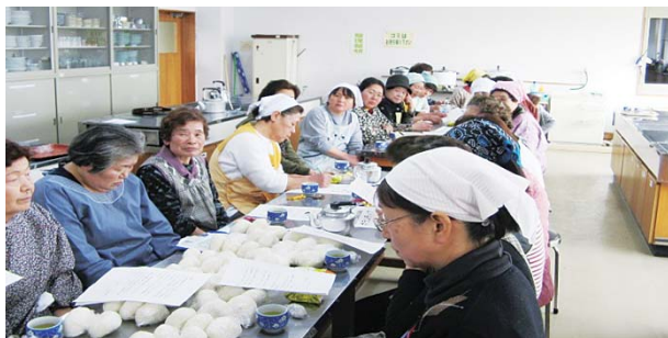
3月11日(金)の東日本大震災で、炊出しボランティアに集ってくれた、稲敷市ボランティア連絡協議会のみなさん 写真1 2

4月より稲敷市社会福祉協議会に、稲敷市ボランティアセンターが設立され、ボランティアセンターから、2カ月に1度、敷市ボランティア通信を発行することとなりました。市内で活躍するボランティアさんの紹介の他に、市内でボランティアの手助け必要としている団体や人、または、ボランティア活動を始めたといった方、ボランティアの活躍を市民の皆さんに知ってもらいたい。そんな気持ちから「稲敷市ボランティア通信」の発行となりました。これから、稲敷市ボランティアセンターでは、ボランティアの力で地域を支え、稲敷市を元気にする！そんな活動を応援して行きます！