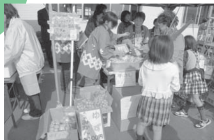
沢山のお買い上げありがとうございました