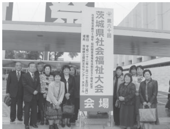
会場前にて記念撮影

ひめゆり会、デイサービスボランティア、桜川更生 保護女性の会、東ボランティア白ゆり会議