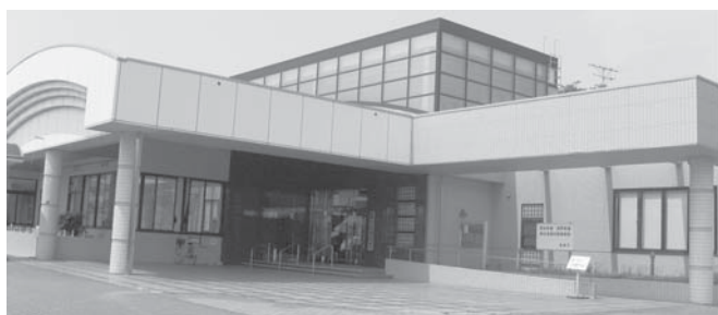
江戸崎福祉センター（江戸崎中央公民館裏）

稲敷市ボランティア連絡協議会は、現在 38 のサークルが施設や地域ニーズに合わせたボランティア活動を行っています。平成 23 年 4 月 1 日から、稲敷市ボランティアセンターを江戸崎福祉センター内に開設いたしました。ボランティアセンターの活用により、今までも増した活動の展開が期待されます。