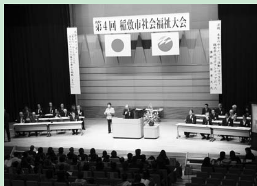
社会福祉大会風景