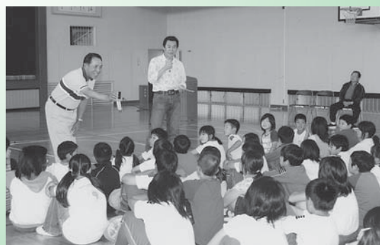
小学校の実践発表から