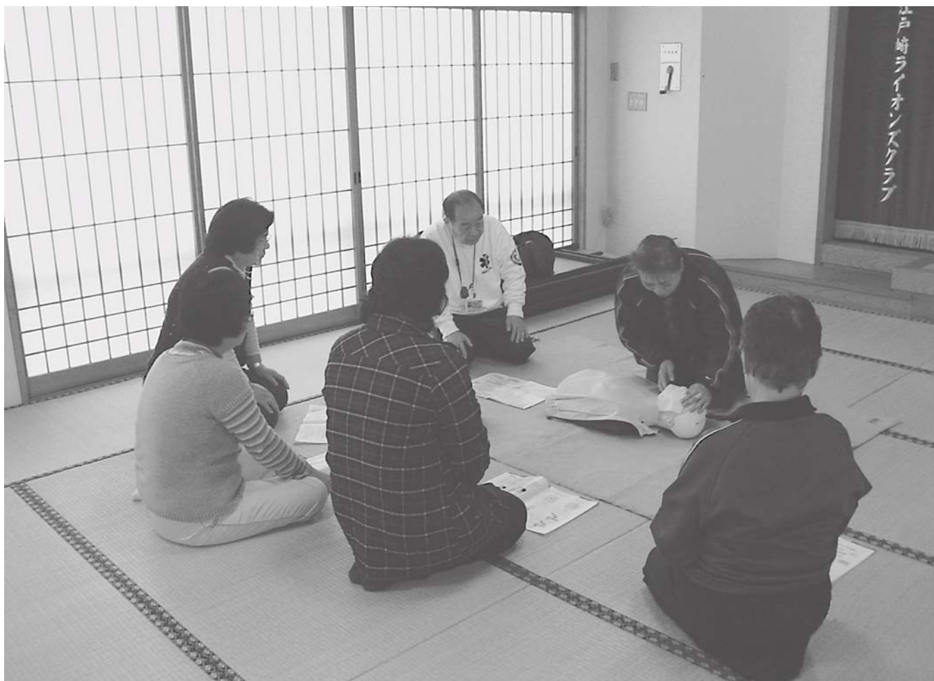
『江戸崎地区ボランティア連絡協議会AED講習』